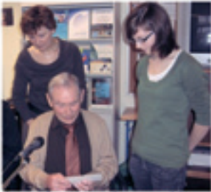
Charles Dekeyser zu Besuch im CFA

Aus Anlass der geplanten Projektarbeit wurde auch am 5. März 2009 Charles Dekeyser, Vorsitzender der ehemaligen belgischen Häftlinge des Konzentrationslagers Flossenbürg, in die Schule eingeladen. Im Juli 2009 wird eine Gruppe von Schülerinnen und Schülern am 11. internationalen Jugendtreffen in dieser Gedenkstätte teilnehmen.